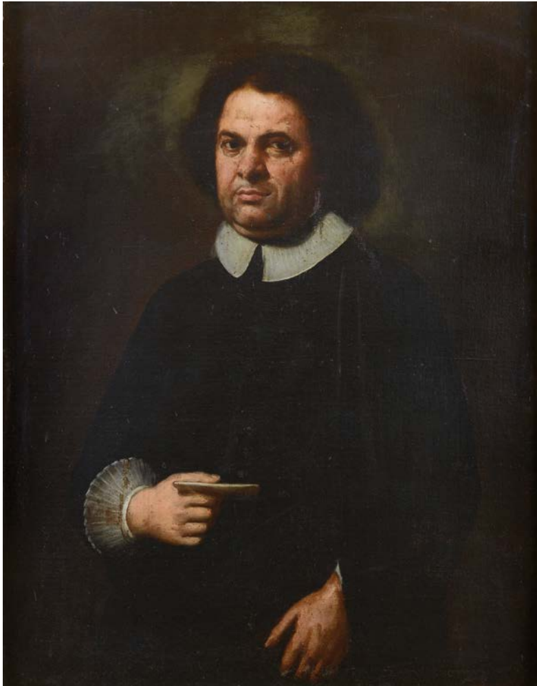
Fig. 19. ANONIMO, Ritratto di Giuseppe Paolucci , olio su tela, post 1727 [?], Roma, Museo di Roma, Dep. Arc. 23 (foto: Roma, Museo di Roma, Archivio Iconografico) © Roma – Sovrintendenza Capitolina ai Beni Culturali – Museo di Roma.