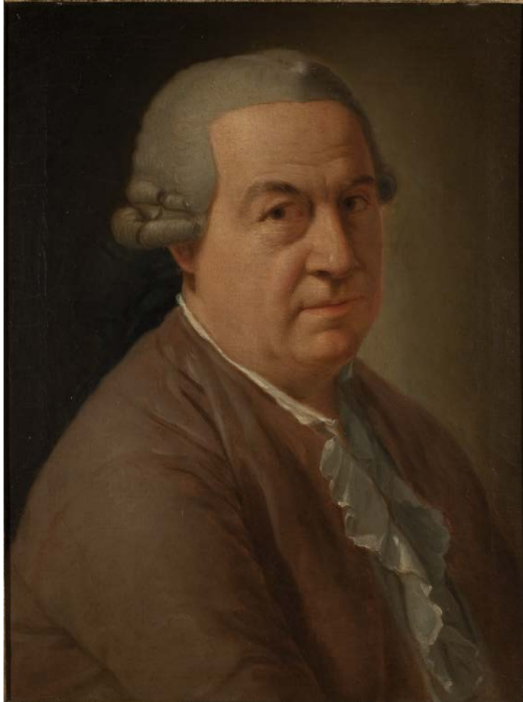
Fig. 23. D. ALVAREZ, Ritratto di Francisco Preciado de la Vega , olio su tela, 1779, Roma, Museo di Roma, Dep. Arc. 72 (foto: Roma, Museo di Roma, Archivio Iconografico) © Roma – Sovrintendenza Capitolina ai Beni Culturali – Museo di Roma.