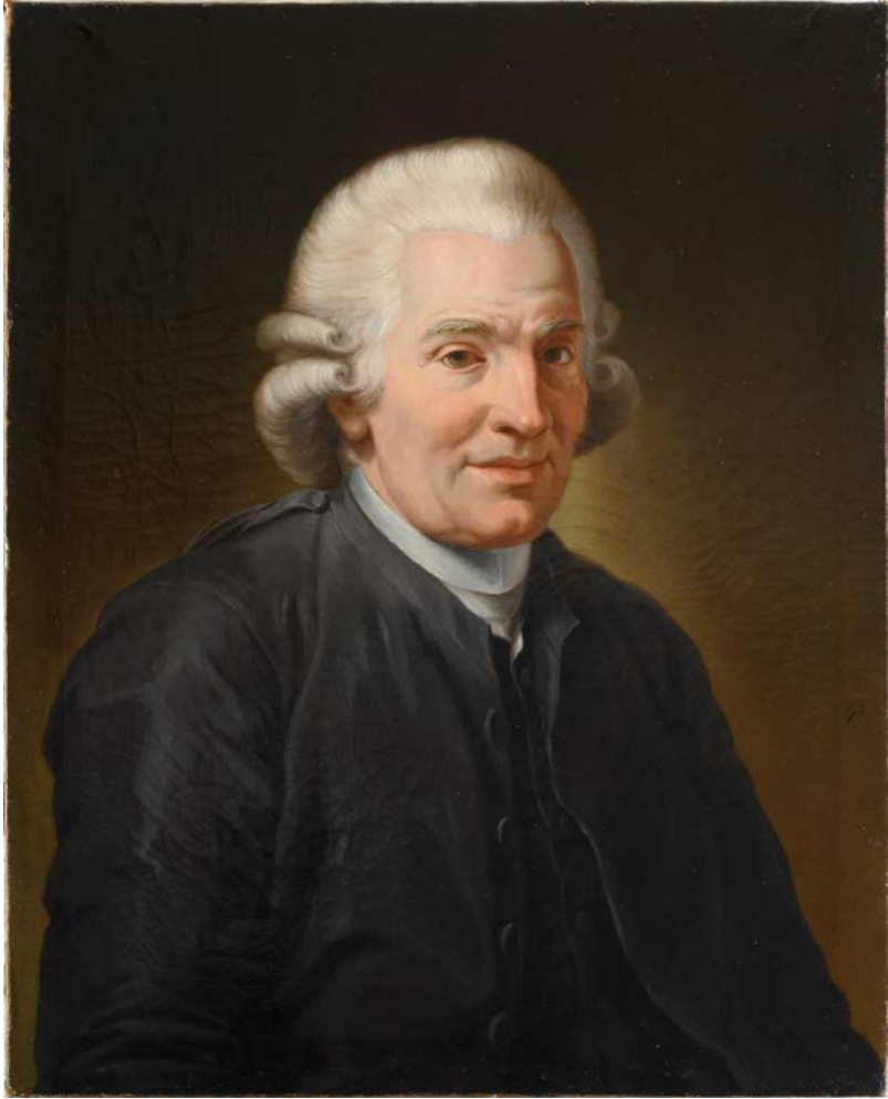
Fig. 25. V. MILIONE, Ritratto di Gioacchino Pizzi , olio su tela, 1790, Roma, Museo di Roma, Dep. Arc. 160 (foto: Roma, Museo di Roma, Archivio Iconografico) © Roma – Sovrintendenza Capitolina ai Beni Culturali – Museo di Roma.