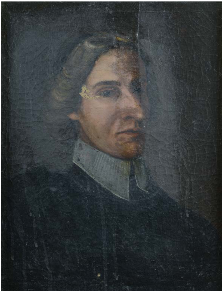
Fig. 18. G. C. GRAZZINI [?], Ritratto di Giovanni Mario Crescimbeni , olio su tela, 1704, Roma, Museo di Roma, Dep. Arc. 156 (foto: Roma, Museo di Roma, Archivio Iconografico) © Roma – Sovrintendenza Capitolina ai Beni Culturali – Museo di Roma.