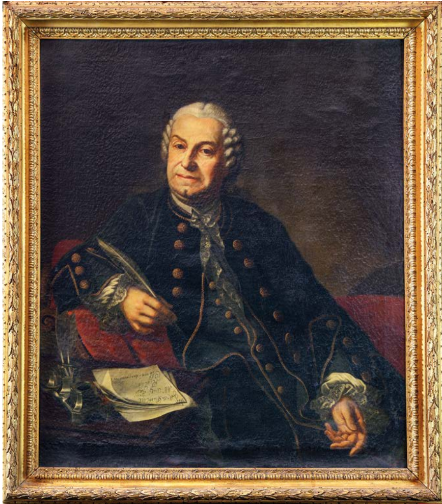
Fig. 20. Pittore viennese [?], Ritratto di Pietro Metastasio, olio su tela, 1766-1767, Roma, Biblioteca Angelica, Dep. Arc. 186