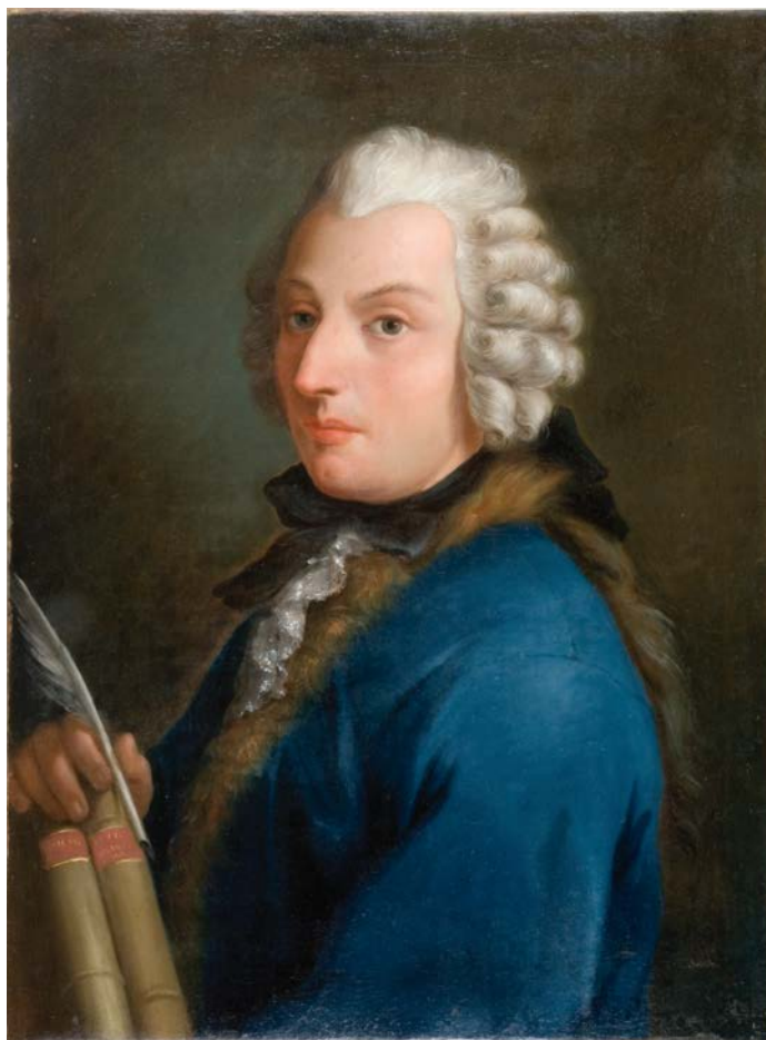
Fig. 24. ANONIMO (da J. E. Liotard), Ritratto di Francesco Algarotti, olio su tela, 1746-1770, Roma, Museo di Roma, Dep. Arc. 165