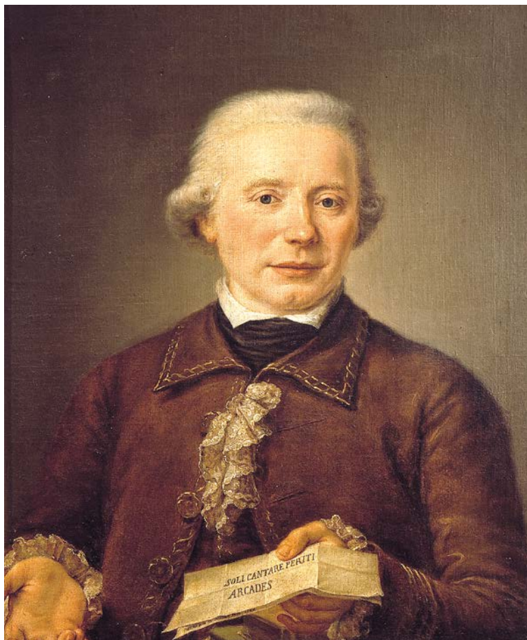
Fig. 22. P. BINI, Ritratto di Melchiorre Cesarotti , olio su tela, 1784, Roma, Museo di Roma, Dep. Arc. 100