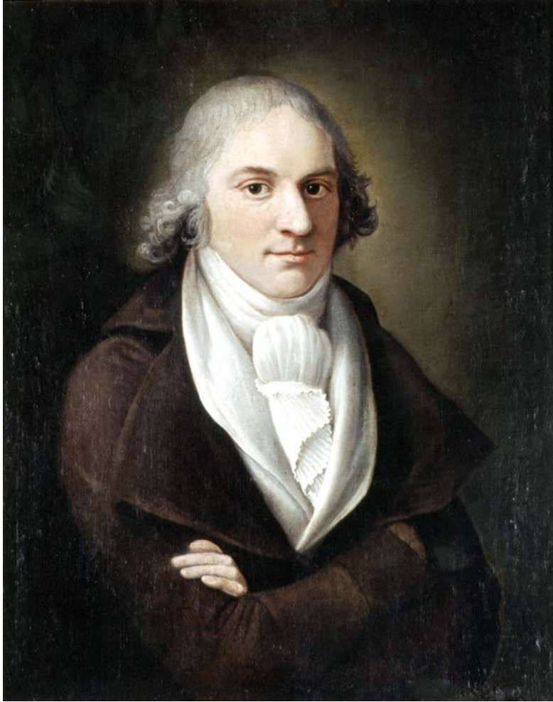
Fig. 26. P. CAPURRO, Ritratto di Gaspare Mollo , olio su tela, 1790, Roma, Museo di Roma, Dep. Arc. 135