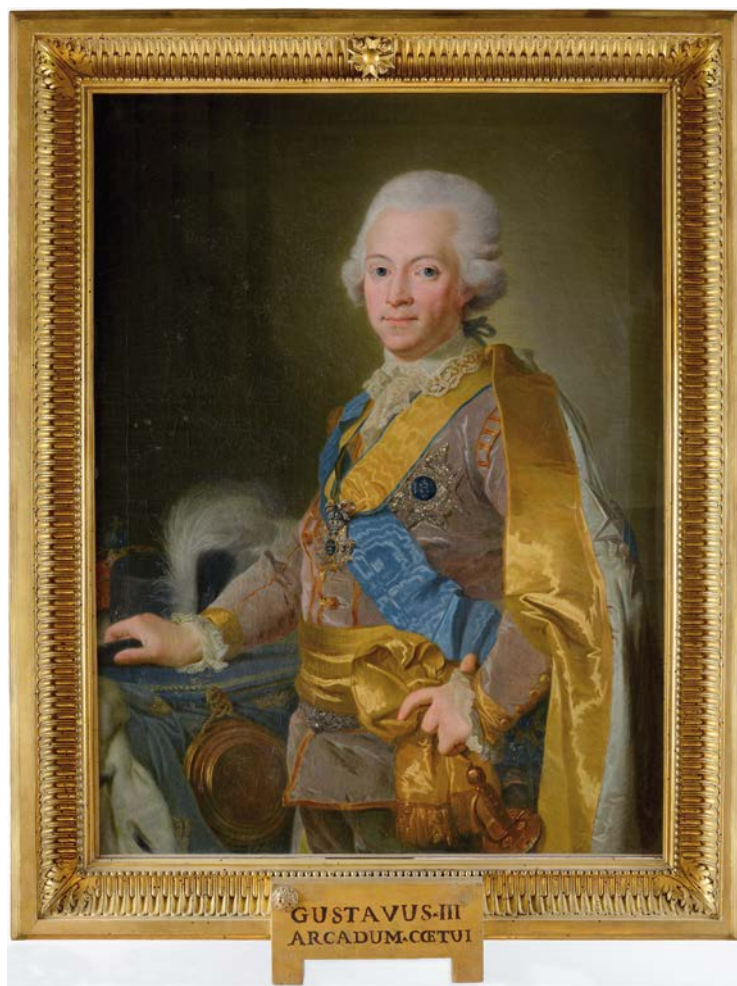
Fig. 21. ANONIMO (da L. Pasch il Giovane), Ritratto di Gustavo III di Svezia , olio su tela, 1788, Roma, Museo di Roma, Dep. Arc. 4 (foto: Roma, Museo di Roma, Archivio Iconografico) © Roma – Sovrintendenza Capitolina ai Beni Culturali – Museo di Roma.